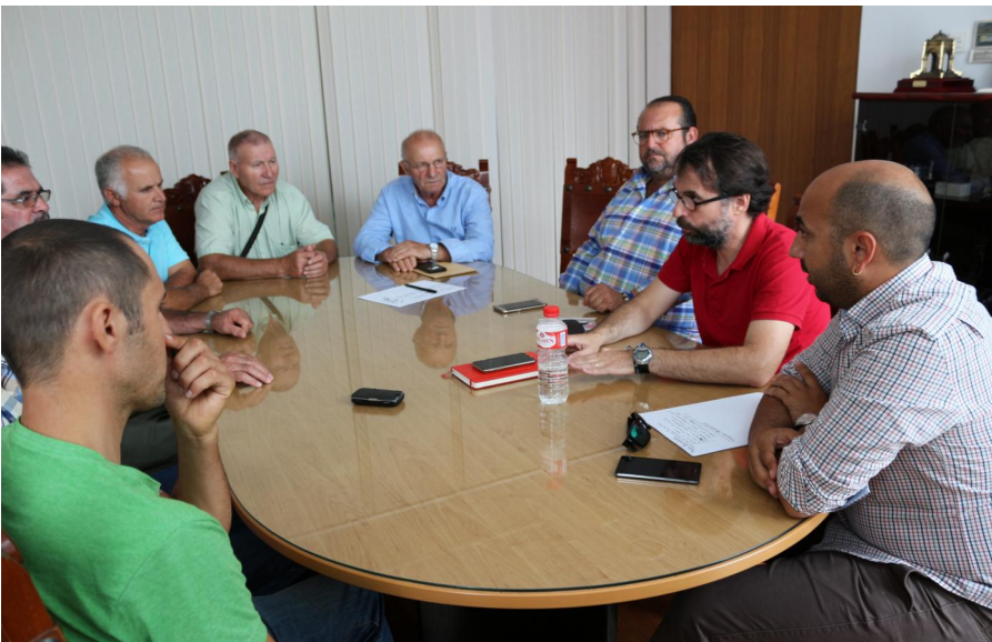
Reunión. · A.I.