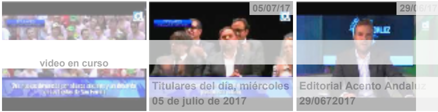
Video Smart Player invented by Digiteka