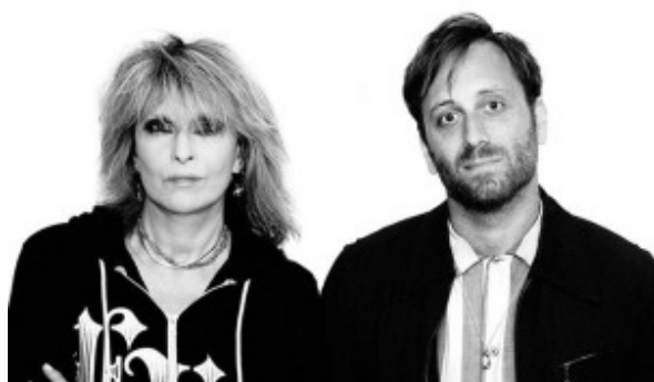
Pretenders y Ben Harper actuarán en Starlite Marbella