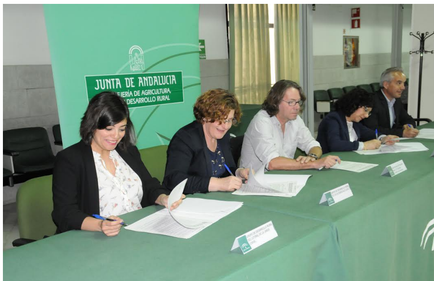
Firma del convenio de la consejería de Agricultura, Pesca y Desarrollo Rural con el GDR del Litoral de la Janda