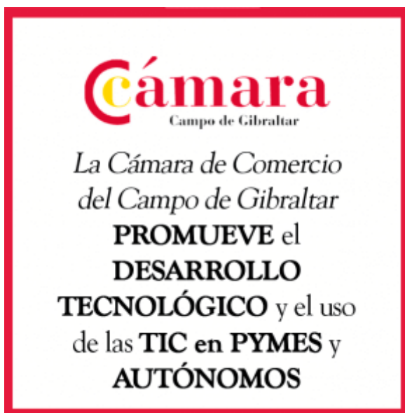
( https://www.algecirasalminuto.es/wp-content/uploads/2022BANNERFIN-300x300-1.gif )