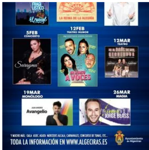
( https://www.algecirasalminuto.es/wp-content/uploads/263666294_2686911661613576_8217475509252146152_n.jpg )