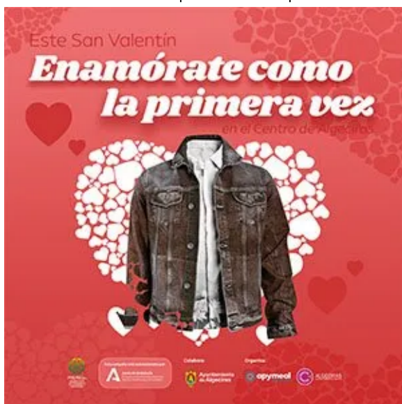
( https://www.algecirasalminuto.es/wp-content/uploads/300x300px-san-valentin-2022-apymeal.jpg )