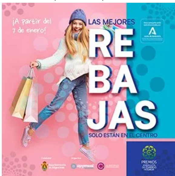
( https://www.algecirasalminuto.es/wp-content/uploads/300x300px-rebajas-2022.jpg )