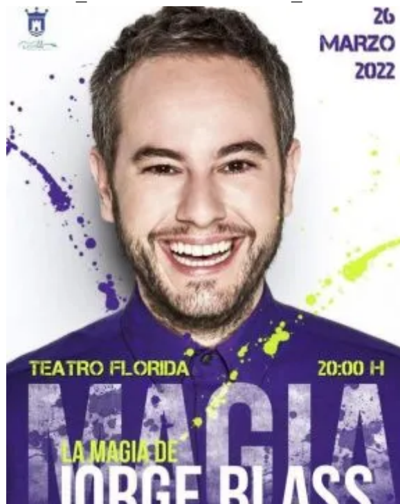
( https://www.algecirasalminuto.es/wp-content/uploads/cda278555faa22971b6455e8b2a1a43ca575cd93ef61bf4998e738d6f91fa9b1-ring-w511-h640-gmir.jpg )