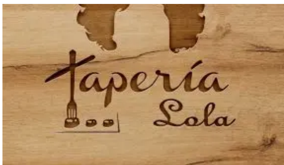
( https://www.algecirasalminuto.es/wp-content/uploads/banner_taperia_Lola.jpg )